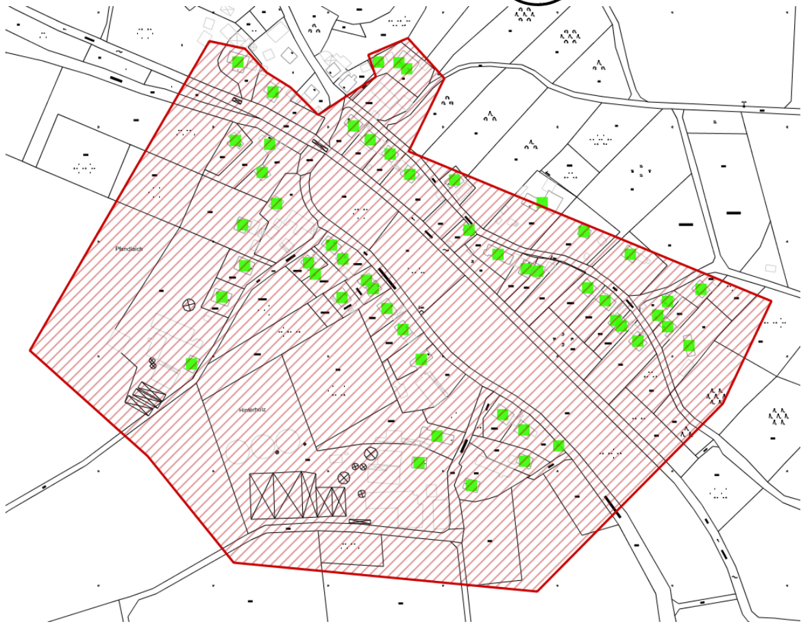
Karte 3: Detail Eurasburg Süd