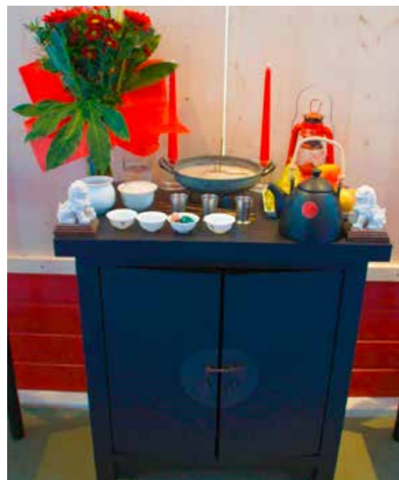
Traditioneller Kung Fu Altar im Trainingsraum.