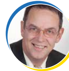
Erich Nagl 1. Bürgermeister von Dasing

Sie halten die erste Ausgabe unse- res umgestalteten Gemeindeboten in den Händen – in neuem Design und neuer Aufmachung, informativ, interessant, mit abwechslungsrei- chen Themen – von Dasingern für Dasing. Ich freue mich sehr, Ihnen mit diesem neugestalteten Magazin das Gemeindeleben in Dasing in neu- em Kleid präsentieren zu können.