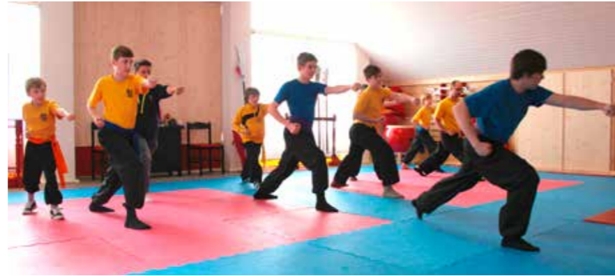
Erste gemeinsame Trainingseinheiten in der neuen Schule.

Der Stil der Schule, das „Tien Shan Pai“, kommt aus dem gebirgigen Norden Chinas. Verglichen mit